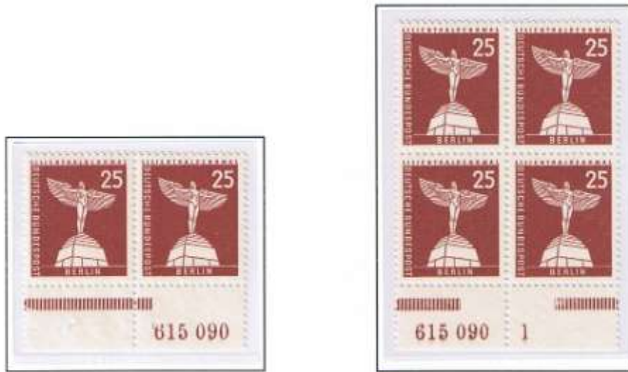
HAN 615 090 2 (links) und 615 090 1. Gummierung: senkrecht geriffelt.

Hausauftrags-Nummern im Bogenrand beim Plattendruck, sind die laufende Nummer des Druckauftrages, meist in Farbe des Postwertzeichens.