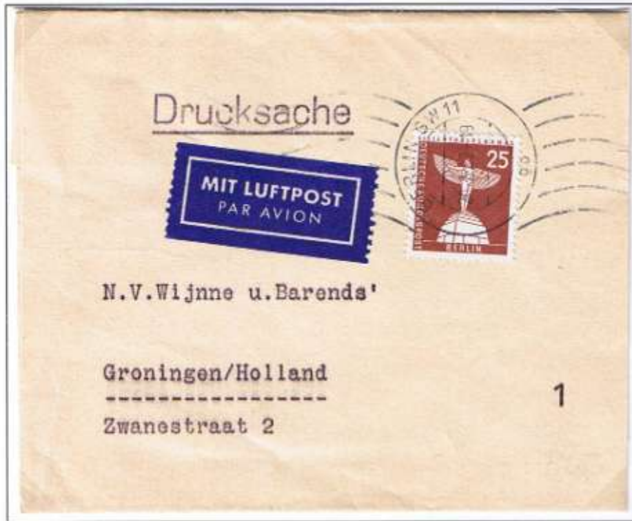
Berlin SW 11, 20.7.62. Europa-Luftpost-Drucksache im Tarif 1.7.54 - 28.2.63. Gebühren: Drucksache bis 50 g 10 Pf und Luftpostzuschlag 15 Pf.