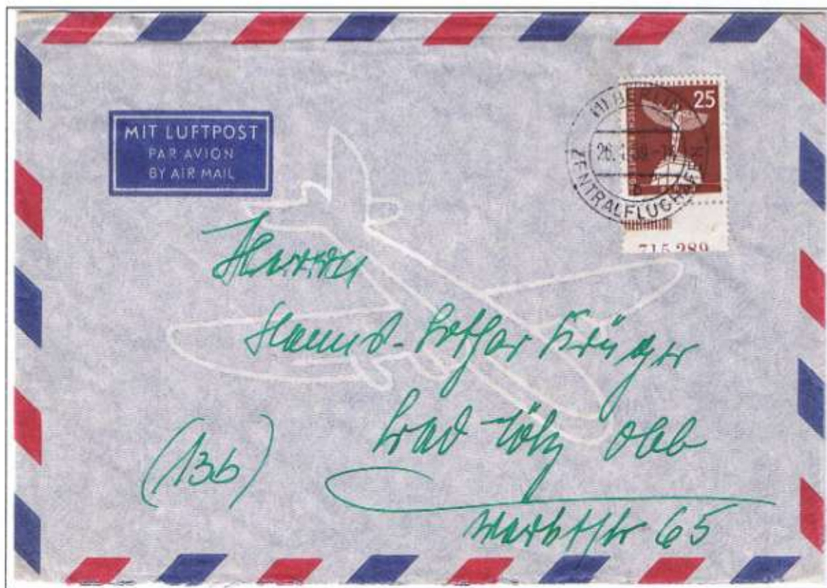
Berlin-Zentralflughafen, 26.1.59. Der 25-Pf-Lilienthalwert in der vorgesehenen Gebührenstufe als Luftpostbrief (Inland) bis 20 g verwendet (20 Pf und 5 Pf). Teil-Hausauftrags-Nr. „715 289“.

Laut MICHEL-Spezial-Katalog sind die Druckerzeichen 7 und 11 und die Hausauftrags-Nummern 615069 56, 615071 56, 615090 1 und 2, 615379 2, 715050 1 und 2, 715289 1 und 2, 717050 1 und 2 und 815098 1 und 2 bekannt.