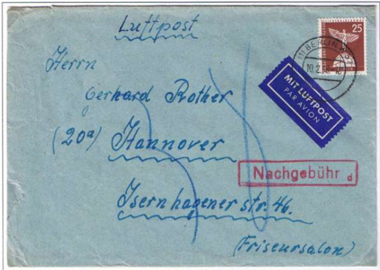
Berlin W 57, 10.2.58. Luftpostbrief über 20 g, nur als Sendung bis 20 g freigemacht. Fehlbetrag 25 Pf mit 150% Nachgebühr (aufgerundet) belegt = 38 Pf. Bis 31.8.1961 war der Luftpostzuschlag eindeutig geregelt.