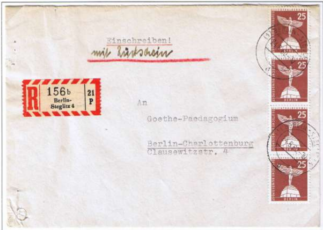
Berlin-Steglitz 4, 24.6.60. Ortsbrief 10 Pf, Einschreiben 50 Pf, Rückschein 40 Pf. Frankatur von der Rolle.