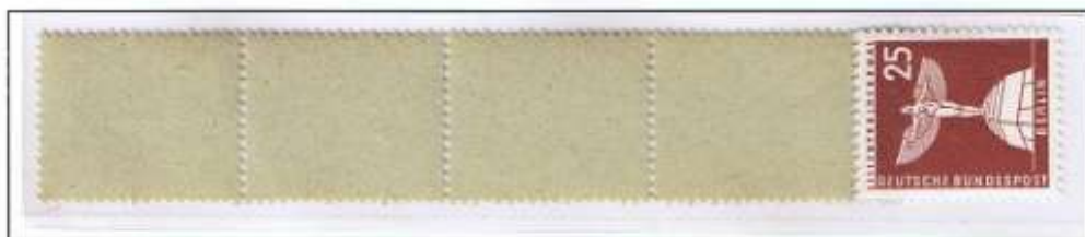
Rollenenden der 1000er Rolle mit gelblichen Leerfeldern ohne Adlerstempel mit senkrechter Gummiriffelung (v).