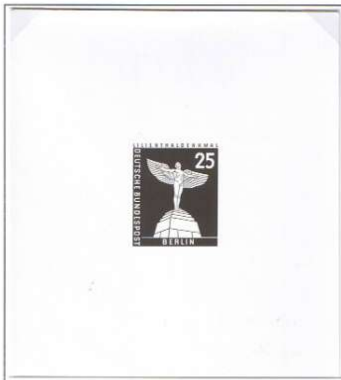
Presse-Foto der Landespostdirektion Berlin, wie es dem Ankündigungsschreiben vom 12.6.1956 als Druckvorlage beigelegt wurde.