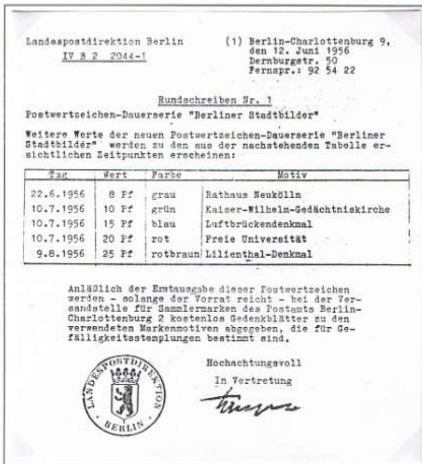
Verkleinertes Rundschreiben der LPD, Berlin, mit Ankündigung u.a. des 25-Pf-Wertes. Beigelegt waren als Presse-Druckvorlagen Fotokartons in schwarz-weiß, der 25-Pf-Lilienthalwert in ungezählter Ausführung.