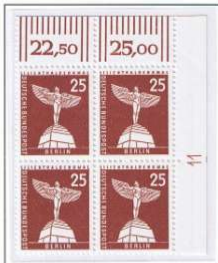
Walzdruck mit Druckerzeichen „11“ im rechten Seitenrand. Weißes Papier und glatter Gummi.