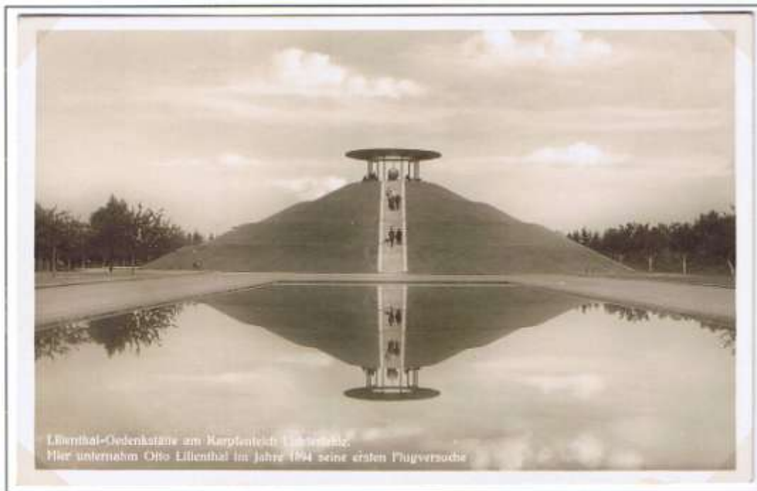
Lilienthal-Gedenkstätte am Karpfenteich Lichterfelde. Hier unternahm Otto Lilienthal im Jahre 1894 seine ersten Flugversuche. Der Fliegeberg am Karpfenteich in Lichterfelde nach der Umgestaltung. Unverkäufliches Originalfoto der Firma Walter Schneider-Römheld, Berlin-Steglitz, welches nur als Druckvorlage verwendet werden durfte. Postkarte gem. Reglement „Luftpost“, Art. 3.3.

Im Rahmen der 3. Ausgabe der Sondermarkenserie „Berlin-Ansichten“ verausgabte die Deutsche Post Berlin am 13.11.1980 einen 40-Pf-Wert, der den oberen Teil des Fliegeberges in der Gestaltung von 1932 zeigt.