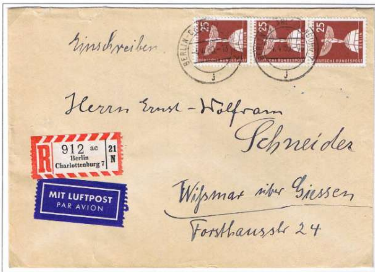
Berlin-Charlottenburg 7, 4.4.60. Fernbrief bis 20 g 20 Pf, Einschreiben 50 Pf und Luftpostzuschlag 5 Pf.