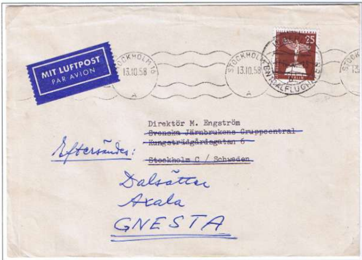
Berlin-Zentralflughafen, 11.10.58. Nachgesandt ab Stockholm 13.10.58. Europa-Luftpost-Drucksache im Tarif vom 1.7.53 - 30.6.54. Gebühren: Drucksache bis 50 g 10 Pf, Luftpost 15 Pf. Identisch mit dem Nachfolgetarif ab 1.7.54 (oben), der erst Erhöhungen ab der 2. Gewichtsstufe aufwies. Klappe offen.