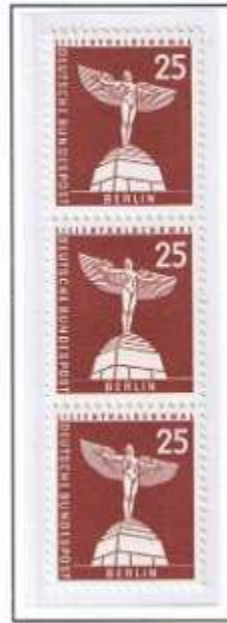
Rollendruck, senkrecht geriffelter Gummi (Nr. 0975)