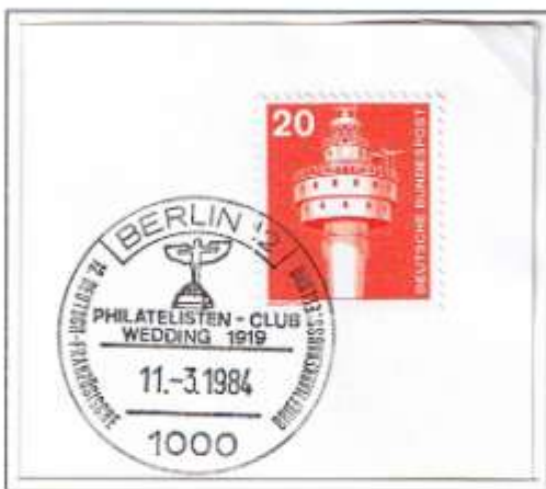
12. Deutsch-Französische Briefmarkenausstellung 1984.