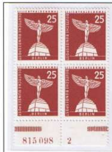
Plattendruck, HAN „815 098 2“. Senkrecht geriffelter Gummi.

Laut MICHEL-Spezial-Katalog sind die Druckerzeichen 7 und 11 und die Hausauftrags-Nummern 615069 56, 615071 56, 615090 1 und 2, 615379 2, 715050 1 und 2, 715289 1 und 2, 717050 1 und 2 und 815098 1 und 2 bekannt.