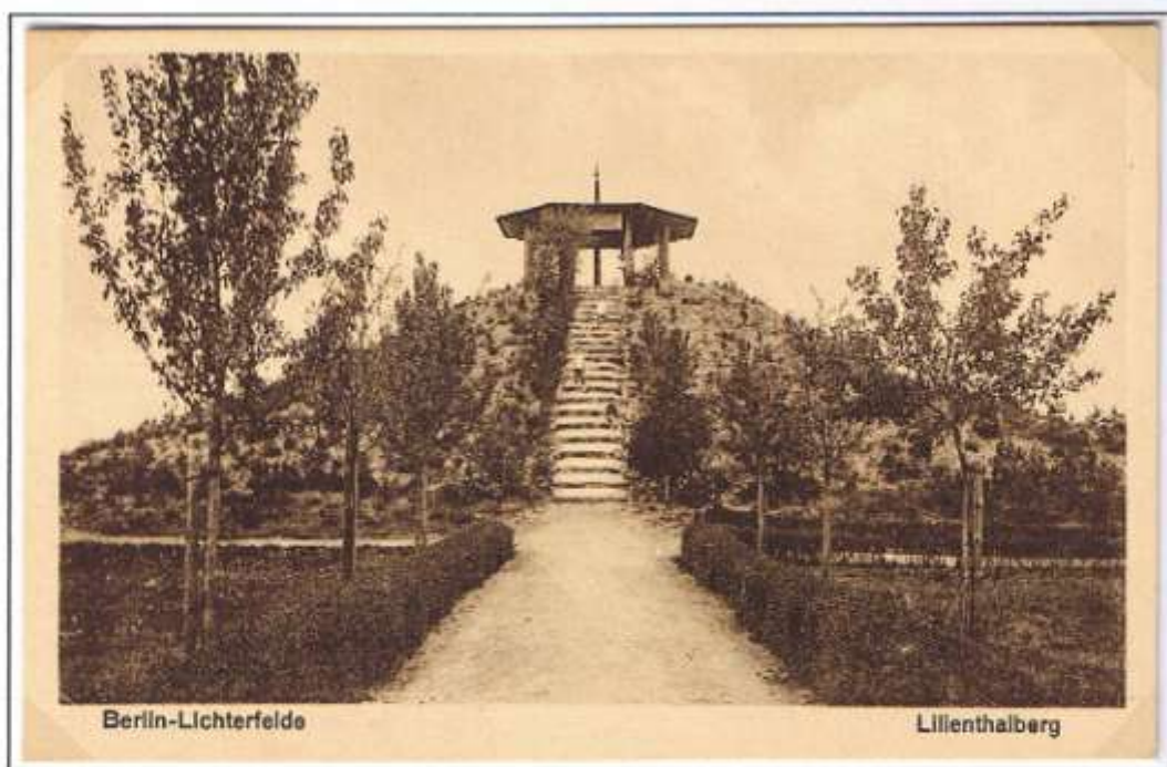
Der 15 m hohe, kegelförmige Hügel, der 10 000 Mark, heute etwa 200 000 Euro kostete, wurde in der Nähe seines Hauses errichtet. Postkarten des Klickow-Verlages, Berlin.