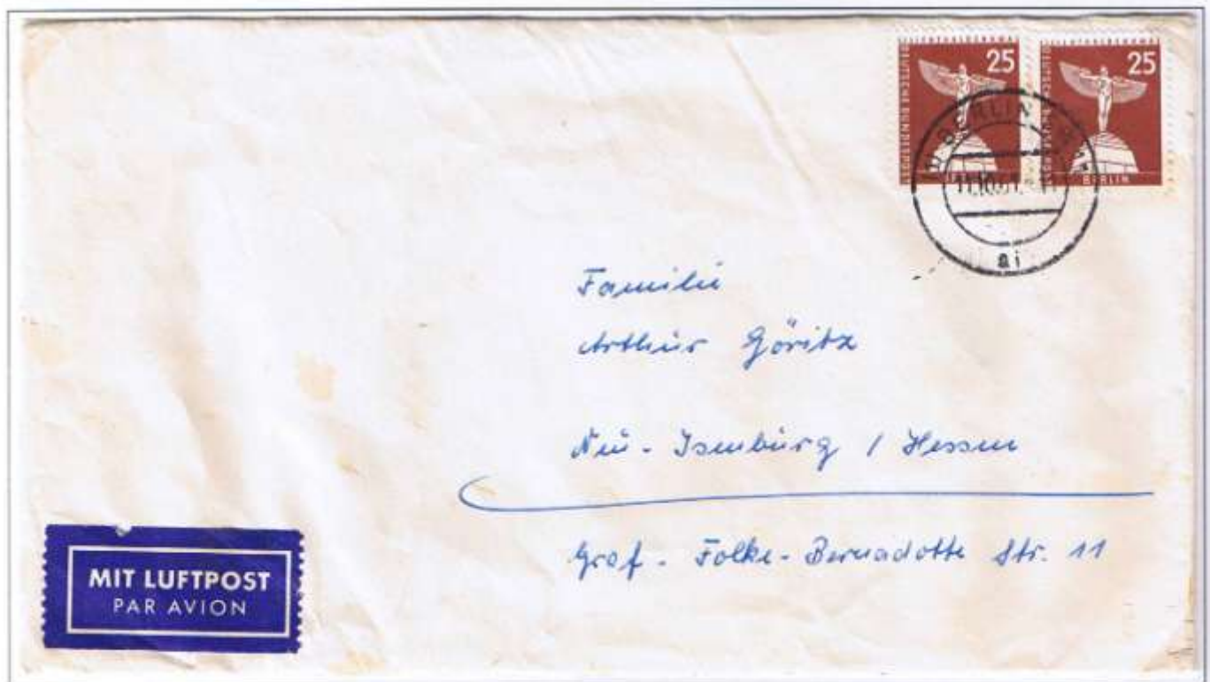
Berlin SW 11, 11.10.61. Brief über 20 g 40 Pf, Luftpostzuschlag 2 x 5 Pf je 20 g. Ab 1.9.1961 eröffnete die DBP aus Gründen der Sicherheit und Beschleunigung ihr Nachtluftpostnetz. Briefe wurden grundsätzlich mit Luftpost befördert. Eine Luftpostgebühr war also nicht mehr erforderlich. Wer Luftpost jedoch verlangte (Aufkleber), bezahlte auch dafür.