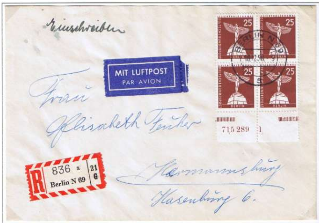
Berlin N 69, 16.12.58. Hausauftrags-Nr. 715 289 1 im unteren Bogenrand. Brief über 20 g 40 Pf, Einschreiben 50 Pf und Luftpostzuschlag 10 Pf.

Hausauftrags-Nummern im Bogenrand beim Plattendruck, sind die laufende Nummer des Druckauftrages, meist in Farbe des Postwertzeichens.