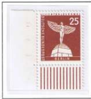
Walzendruck, glatter Gummi

Der 25-Pf-Wert „Otto-Lilienthal-Denkmal“, wurde im Bogen zunächst nur im Plattendruck hergestellt, später nur noch im Walzendruck. Beide Druckarten kommen mit geriffeltem und glatter Gummi vor.