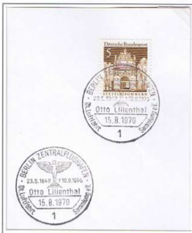
Deutsche Luftfahrtsammlung e. V. im Zentralflughafen 1970.