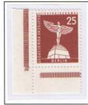
Plattendruck, senkrecht geriffelter Gummi