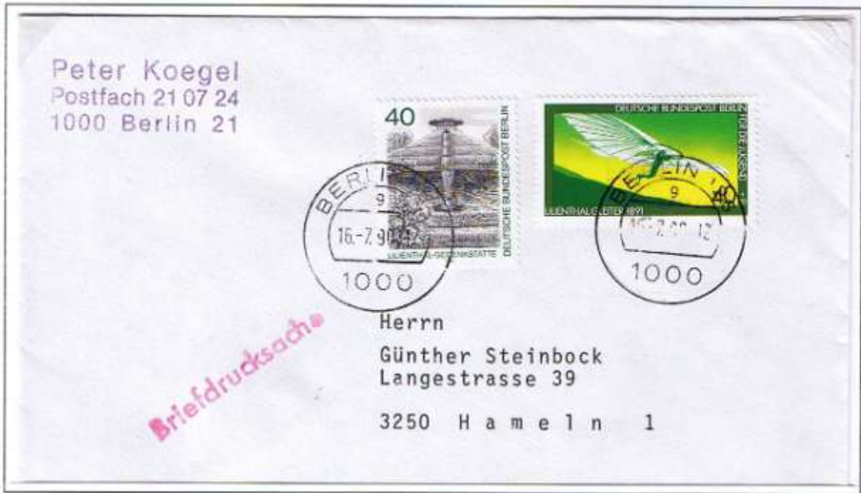
Aufgabe in Westberlin. Berlin 21, 16.7.90 (Erstmonat der Währungsunion).

Was bei Herausgabe der hier gezeigten Berlin- und DDR-Postwertzeichen unmöglich erschien, wurde 1990 Wirklichkeit. Ausgaben beider Gebiete konnten zusammen auf einer Sendung „fliegen“.