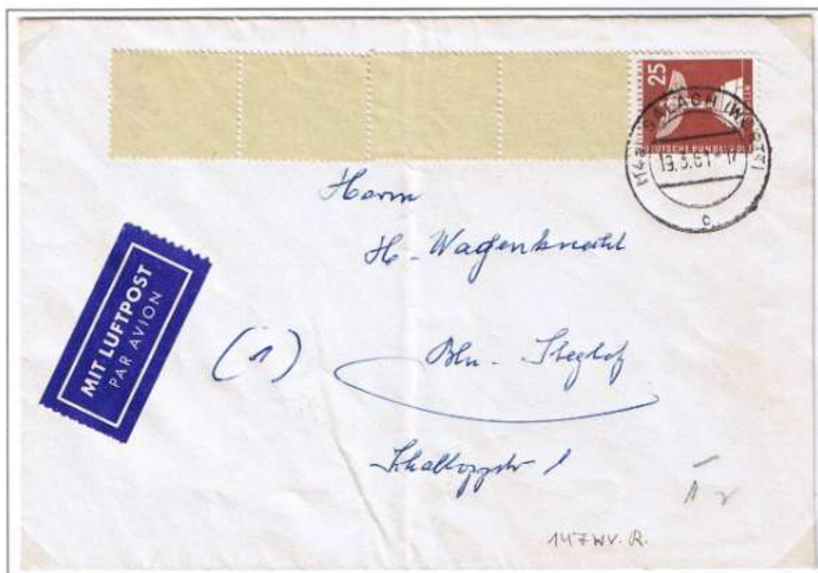
Salach, 19.3.61. Brief bis 20 g 20 Pf und Luftpostzuschlag 5 Pf. Gelbliche Leerfelder ohne Adlerstempel, senkrechte Gummiriffelung (v). Nicht fluoreszierendes transparentes grauweißes Papier mit stark ausgeprägtem Wasserzeichen (w).

Das im Bäkepark am Teltowkanal stehende Denkmal, trägt rückseitig die prophetischen Worte Leonardo da Vincis: „Einst wird der große Vogel seinen Flug nehmen vom Rücken des Hügels, die Welt mit Erstaunen, das Universum mit seinem Ruhm füllen und ewige Glorie wird sein dem Ort, da er geboren ward“.