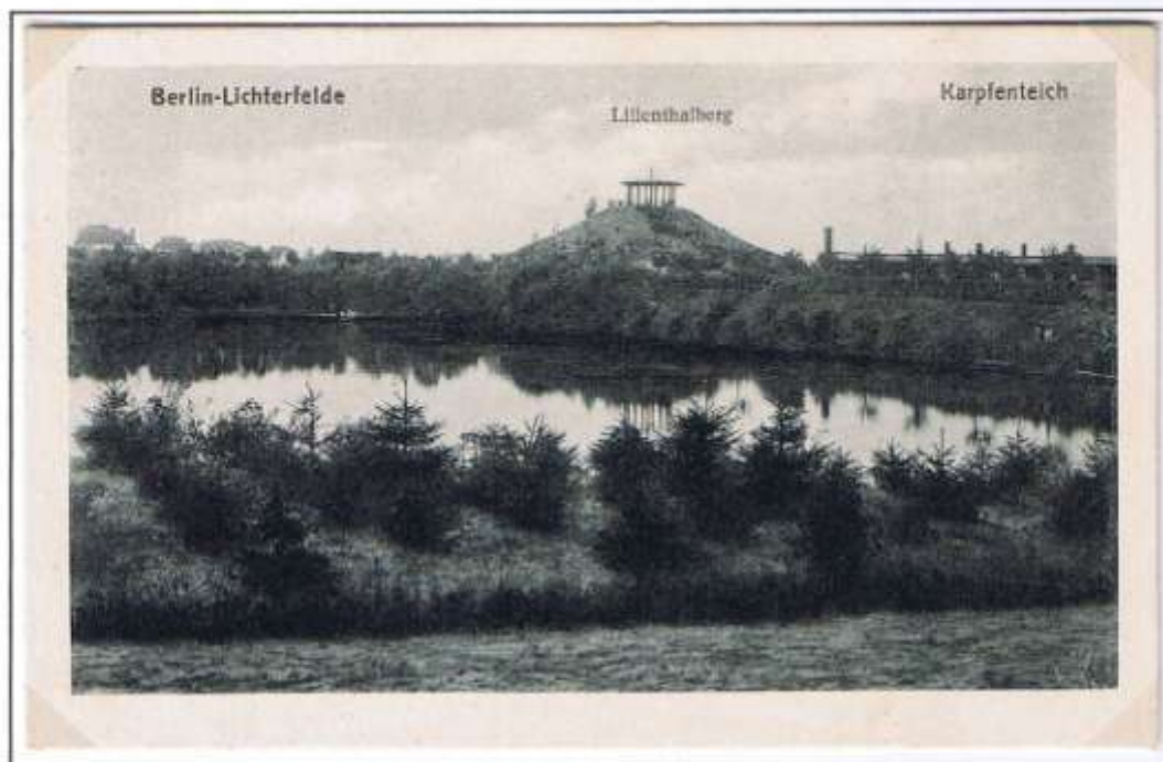
Der Flughügel vor der Umgestaltung in Berlin-Lichterfelde. Im Jahre 1932 ließ die Stadt Berlin Otto Lilienthals Flughügel umgestalten, der bis 1894 aus Abraum einer Ziegelei errichtet worden war. Postkarte geschrieben: Dezember 1915.