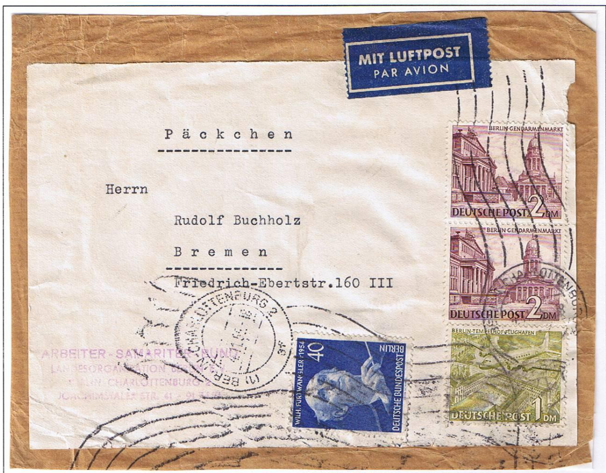
Berlin-Charlottenburg 2, 4.11.55. Luftpost-Päckchen mit einem Gewicht von 1880 g, nahe dem zulässigen Höchstgewicht von 2 kg. Päckchen 70 Pf und Luftpostzuschlag 4,70 DM (94 x 5 Pf je angefangene 20 g). Gesamtgebühr: 5,40 DM.

Luftpostaufkleber (Rollendruck) können nur auf Belegen ab August 1951 vorkommen, da ab diesem Tag die Ablösung der Bogendrucke erfolgte. Die Abgabe erfolgte in Rollen zu 500 Stück.