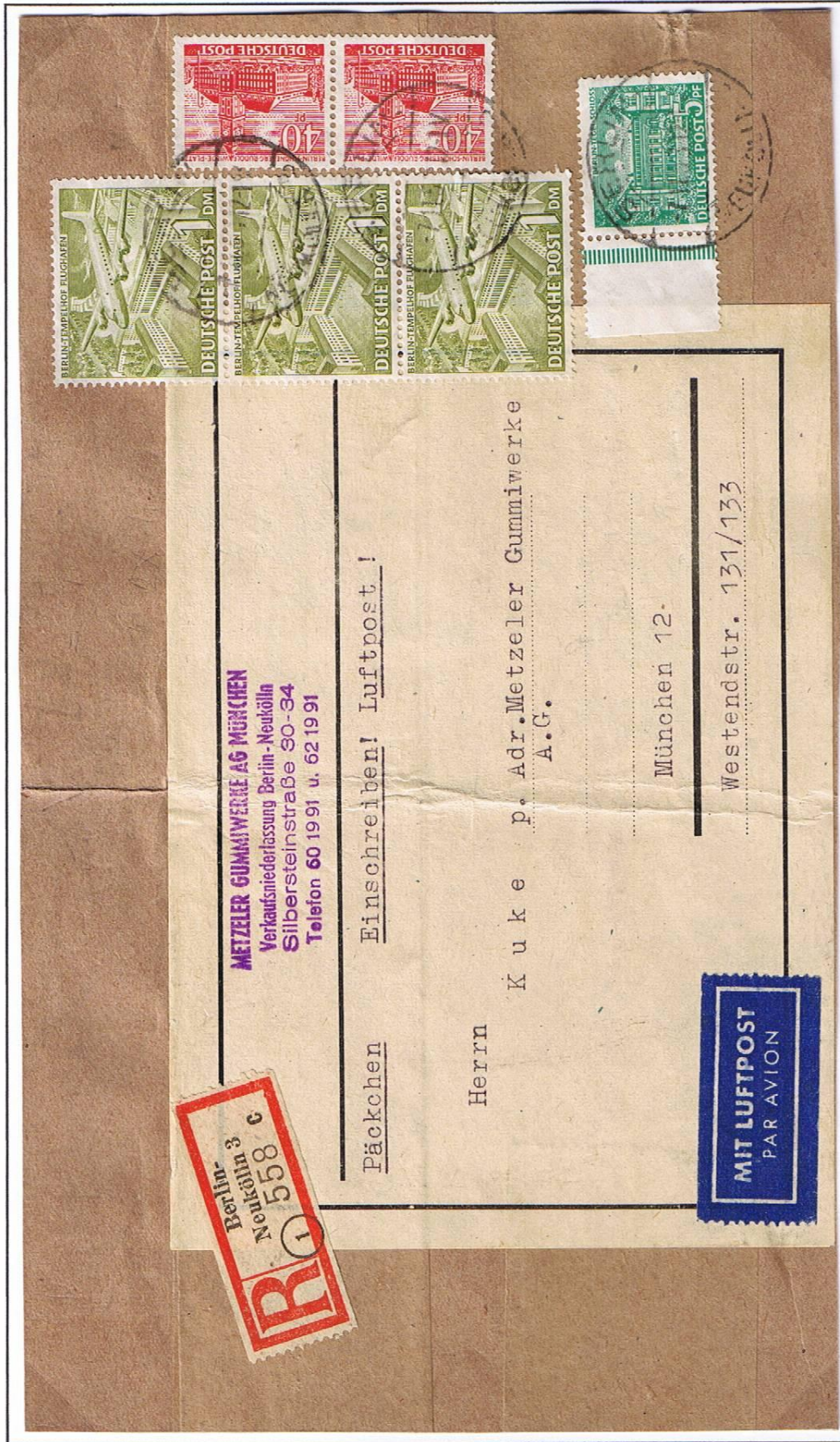
Berlin-Neukölln 3, 07.11.54. Päckchen über 1060 g im 2. Tarif ab 01.07.54. Päckchen: 70 Pf, Einschreiben: 50 Pf, Luftpostzuschlag (53 x 5 Pf): 2,65 DM.