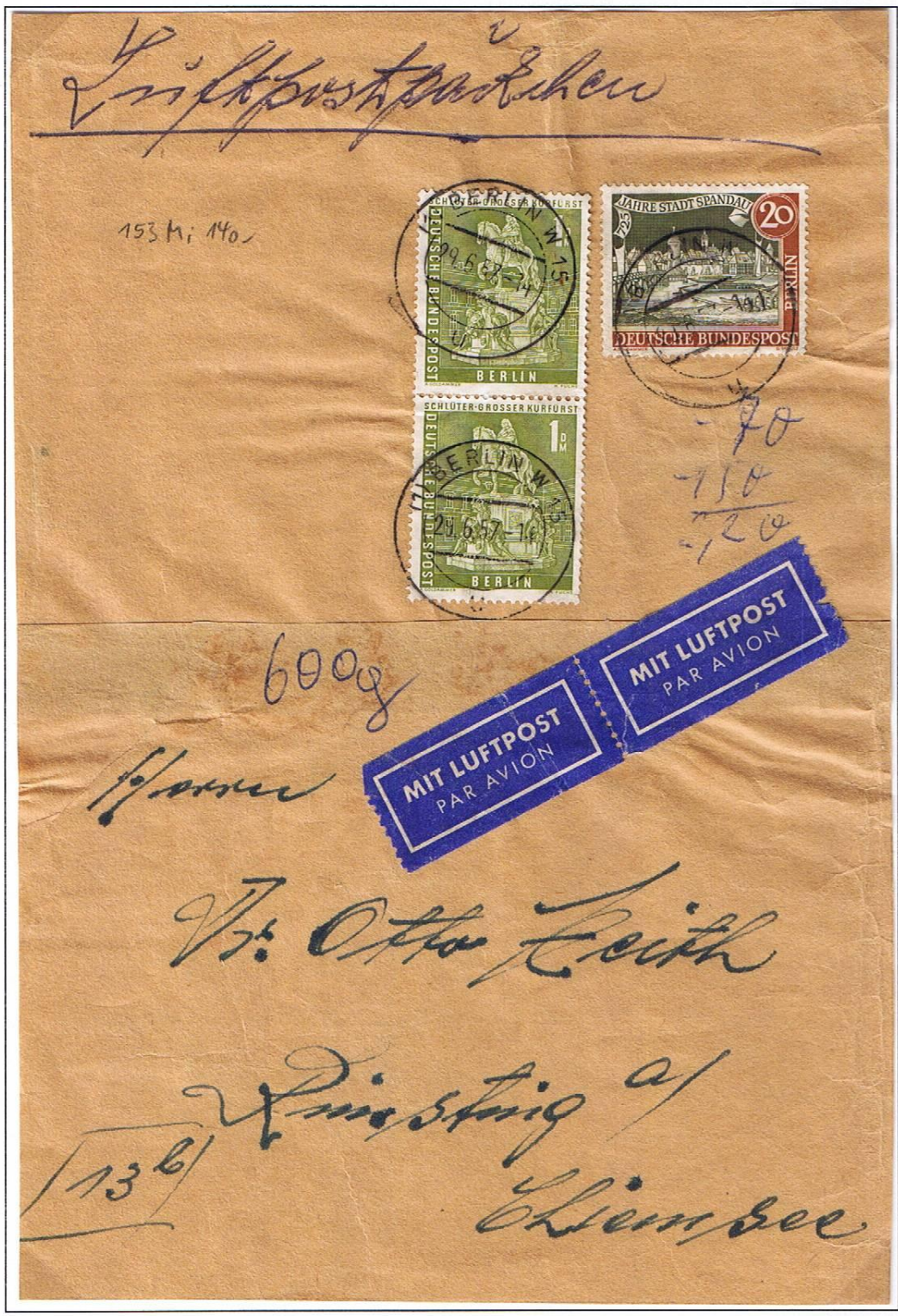
Berlin W 15 u, 29.6.57. Päckchen 70 Pf, Luftpostzuschlag für 600 g 30 x 5 Pf = 1.50 DM (5 Pf je angefangene 20 g).