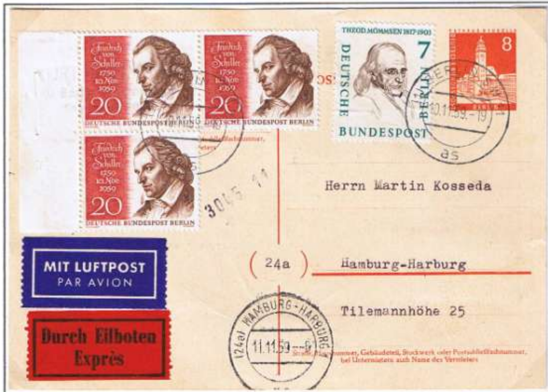
Berlin SW 11, 10.11.59 -19. Ortspostkarte (P 42) affrankiert für den Fernverkehr: 10 Pf, Luftpostzuschlag: 5 Pf und Eilboten: 60 Pf. Abgeleitet mit Nachtflug auf Hamburg-Harburg 1, 11.11.59 -6.

Nach Erscheinen der neuen Dauerserie „Berliner Bauten II“ ab 1956, wurden in den Folgejahren verschiedene Vordruck-Änderungen vorgenommen. 1957/58: Postleitzahlenkreise jetzt Klammern, Änderungen der Punkt- und Vordruckzeilen usw. Ab 1959 erschienen die Ortspostkarten in geänderter Werteindruck-Farbe (jetzt Farbe Rot anstatt Grau).