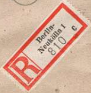
Berlin-Neukölln 1, 24.09.49. Fernbrief über 20 - 40 g: 40 Pf, Luftpostzuschlag: 10 Pf und Einschreiben: 40 Pf. Ankunft: Marburg/Lahn, 26.09.49.