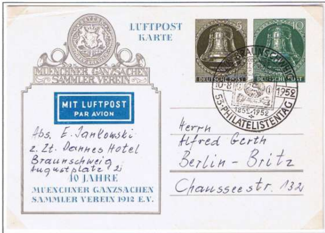
Privat-Ganzsachen-Postkarte mit zwei Werteindrucken (Sondermarken). Braunschweig, 10.08.52. (53. Philatelistentag). Postkarte: 10 Pf, Luftpostzuschlag: 5 Pf.