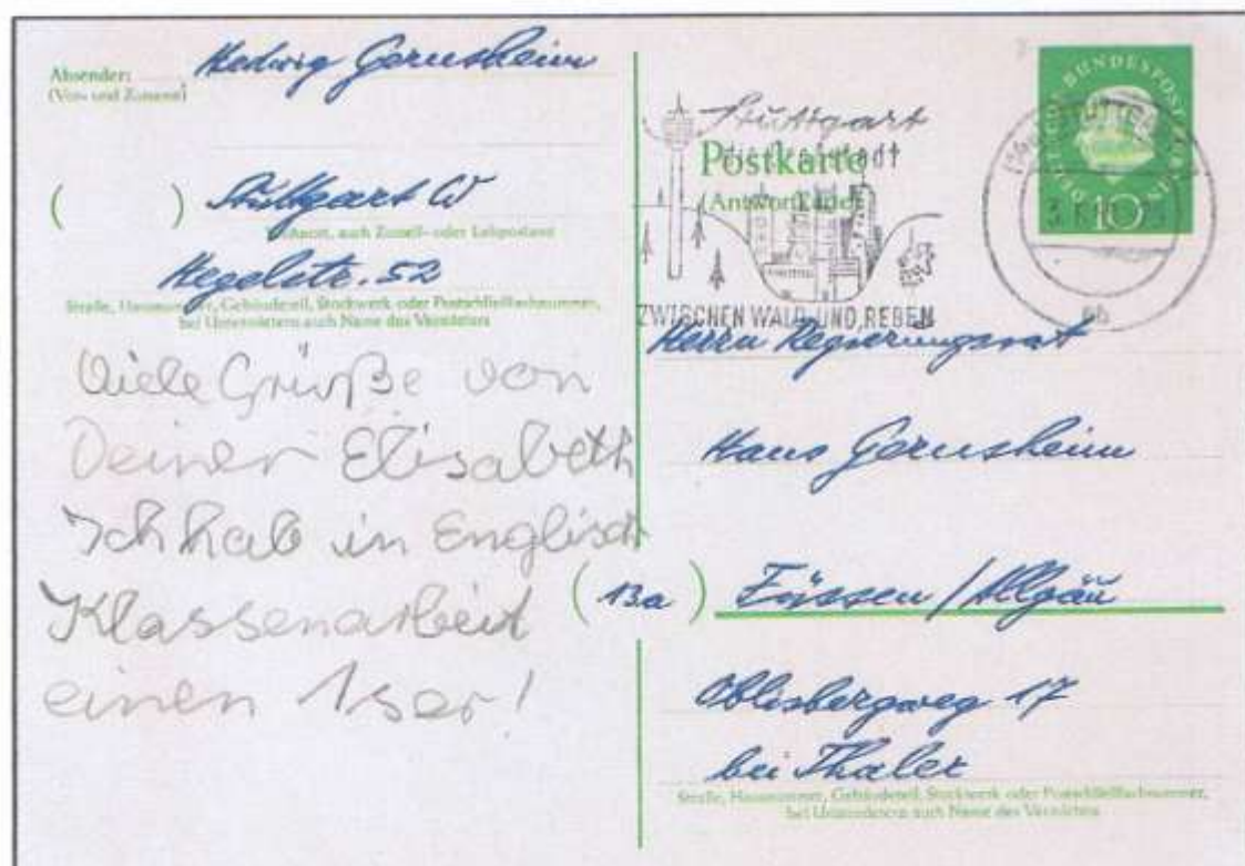
Ungetrennte Inlandspostkarte mit Antwortkarte. Scan des Anhanges (A-Teil) des obigen F-Tei- les. Stuttgart, 03.06.59. Rücksendung als gewöhnliche Inlandspostkarte.