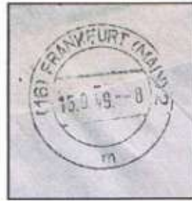
Transitstempel Frankfurt (Main) 2.

Die Durchgangsstempel der „Auslandsstelle/Luftpoststelle“ Frankfurt (Main), die früher dem Postamt 19 (Bahnpostamt) und in den Jahren der Westberliner IAS-Luftpost dem Postamt 2 unterstellt war, weisen für IAS-pflichtige Auslandsluftpost, durch Stempelabschlag auf der Rückseite, die Ableitung über die mittlere Flugschneise der Luftbrücke und den Durchgang über den Flughafen Frankfurt (Main) nach. Obwohl vorgeschrieben, kommen Durchgangsstempel nicht auf jeder Luftpostsendung vor. Die Beförderungszeit vom Flughafen Berlin-Tempelhof auf Frankfurt (Main) betrug, je nach Aufgabezeit, 2 - 3 Tage.