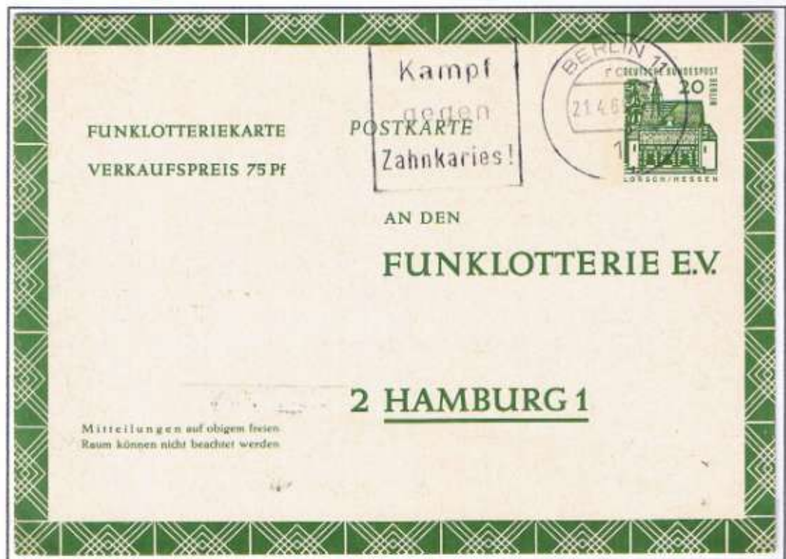
Einsendung zur letzten Funklotteriesendung. Einstellung im April 1969. Berlin 11, 21.04.69. Mit der Portoerhöhung auf 20 Pf zum 01.04.66, erschien als letzte Berlinausgabe FP 8 mit Werteindruck „Torhalle Lorch“.