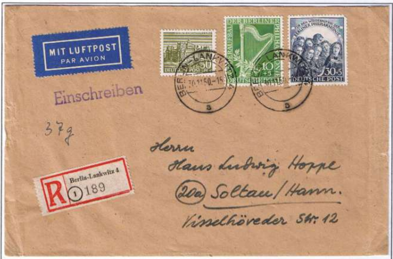
Berlin-Lankwitz 4 (Zweig-PA), 30.11.50. Fernbrief über 20 - 40 g: 40 Pf, Luftpost: 10 Pf und Einschreiben: 40 Pf. Ankunft (Sonderstempel): Soltau, 01.12.50.