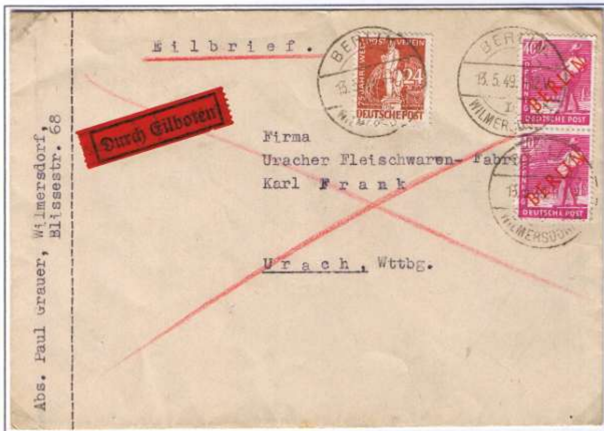
2. Tag nach Blockade-Ende und Letztmonat des 1947er Reichsmarktarifes in DM. Berlin-Wilmersdorf, 13.05.49. Fernbrief bis 20 g: 24 Pf und Eilboten: 80 Pf. Kein Ankunftsstempel.