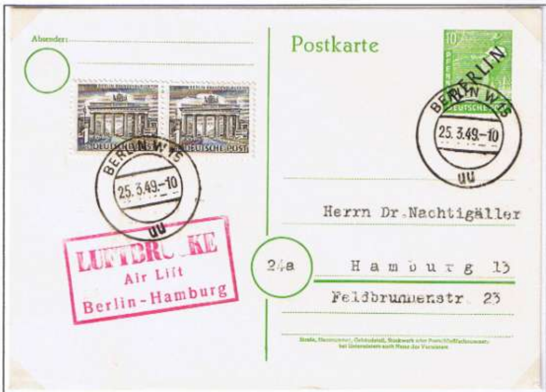
Erste Postkarten-Ganzsache als Eigenausgabe. Berlin W 15, 25.03.49. Mischfrankatur in dieser Kombination nur 11 Tage lang möglich. Flugleitstempel Typ b. Abstand zwischen 2. und 3. Zeile 4 mm. Roter Leitstempel auch in der Farbe Blau auf Postschnelldienst-Erstfahrt-Umschlag bekannt. Auflage: 10 Stück lt. K. Dahmann.