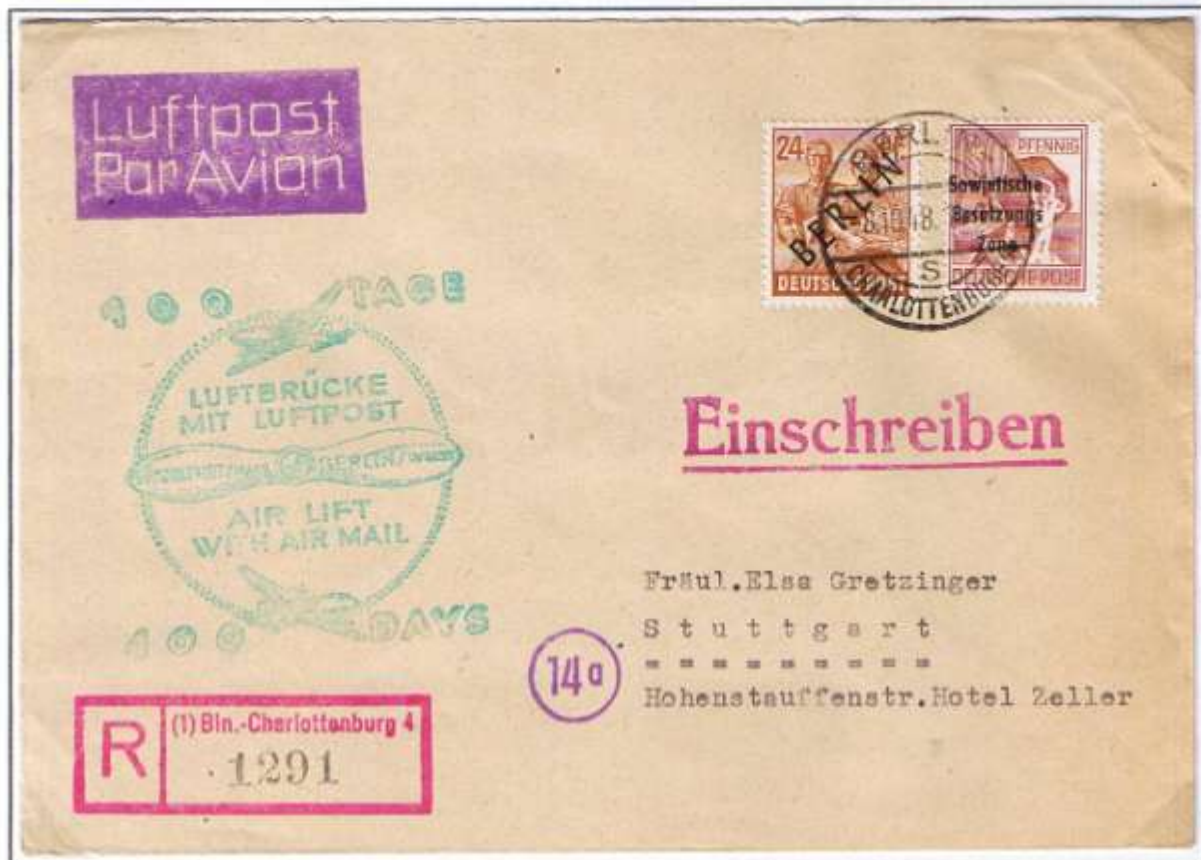
Privater Flugleitstempel „100 Tage Luftbrücke Berlin“ mit Flugzeug Typ Skymaster. Berlin-Charlottenburg 4, 08.10.48. Fernbrief: 24 Pf und Einschreiben: 60 Pf als SBZ-Westberlin-Frankatur. Zweisprachiger grüner Stempel der Firma E. Mohnke, Berlin, eingesetzt vom 28.09. - 08.10.48 mit Aufgaben bei verschiedenen Postämtern, also vor und nach dem 100-Tage-Jubiläum. Der rote R-Stempel weist einen eingearbeiteten Numerator als Paginierstempel auf. Lt. Verfügung wurden Frankaturen mit SBZ-Marken nicht über die Luftbrücke geflogen. Hier jedoch 2 x geflogen. Ankunft Stuttgart, 19.10.48 und zurück, Ankunft Berlin-Charlottenburg 4, 24.10.48.