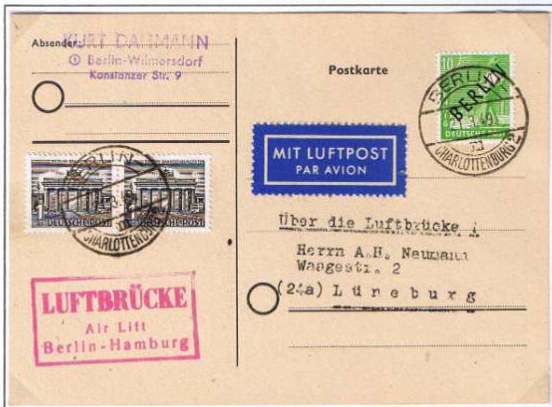
Ersttag 1 Pf Berliner Bauten I und Ersttag 2. Währungsreform. Berlin-Charlottenburg 2, 21.03.49. Flugleitstempel Typ a. Abstand zwischen 2. und 3. Zeile 2 mm. Mischfrankatur Schwarzaufdruck mit Berliner Bauten 1 Pf, nur 11 Tage lang möglich.