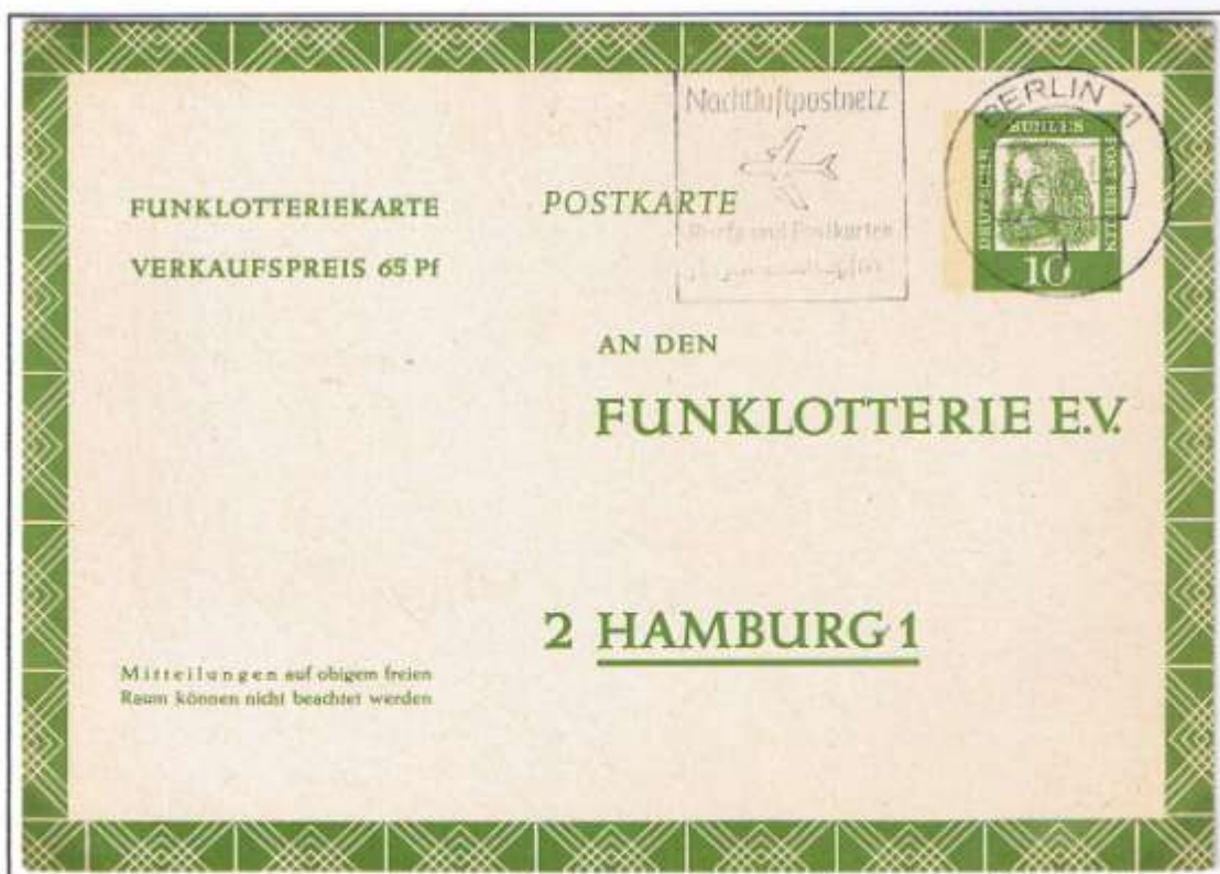
Albrecht Dürer. Berlin 11 mit Werbeeinsatz „Nachtluftpostnetz / Briefe und Postkarten / fliegen zuschlagsfrei“. FP 6-Aufgaben ohne Zusatzfrankatur, waren nur kurzzeitig möglich: 1962 - 28.02.63.