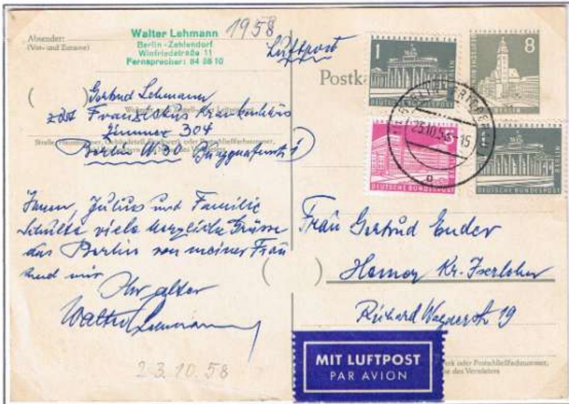
Berlin-Friedenau 1, 23.10.58. Ortspostkarte (P 35) affrankiert für den Fernverkehr: 10 Pf und Luftpostzuschlag: 5 Pf.

Nach Erscheinen der neuen Dauerserie „Berliner Bauten II“ ab 1956, wurden in den Folgejahren verschiedene Vordruck-Änderungen vorgenommen. 1957/58: Postleitzahlenkreise jetzt Klammern, Änderungen der Punkt- und Vordruckzeilen usw. Ab 1959 erschienen die Ortspostkarten in geänderter Werteindruck-Farbe (jetzt Farbe Rot anstatt Grau).