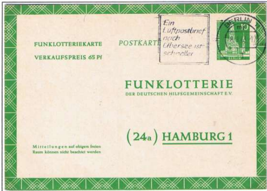
Kaiser-Wilhelm-Gedächtniskirche. Berlin 11, 18.01.63. FP 5 konnte ohne Zusatzfrankatur wegen Gebührenerhöhung im Nachtluftpostdienst von 1957 bis 28.02.63 verwendet werden.

Am 01.09.61 startete die Deutsche Bundespost ein Millionenprojekt, den Nachtluftpostdienst. Lufthansa-Flugzeuge beförderten auf ausgeklügelten Routen luftpostzuschlagsfrei Postsendungen (Briefe und Postkarten), die bereits am Folgetag nach der Einlieferung zugestellt wurden. Ab Westberlin realisierte die Pan America den Anschluss an den Nachtluftpoststern Frankfurt/Main. Nachtluftpost existierte neben zuschlagspflichtiger Luftpost (je 20 g 5 Pf) bis zur Funklotterie-Einstellung im April 1969.