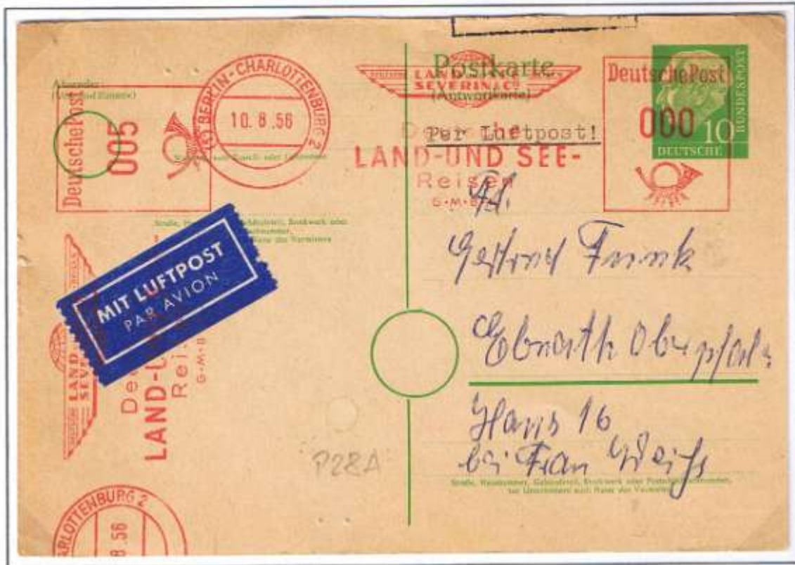
Bundesrepublik-Postkarte mit Antwort „Heuss I“ nach Berlin und Antwortteil zurück, auf frankiert Berlin-Charlottenburg 2, 10.08.56 mit Absenderfreistempel 5 Pf für Luftpostzuschlag.