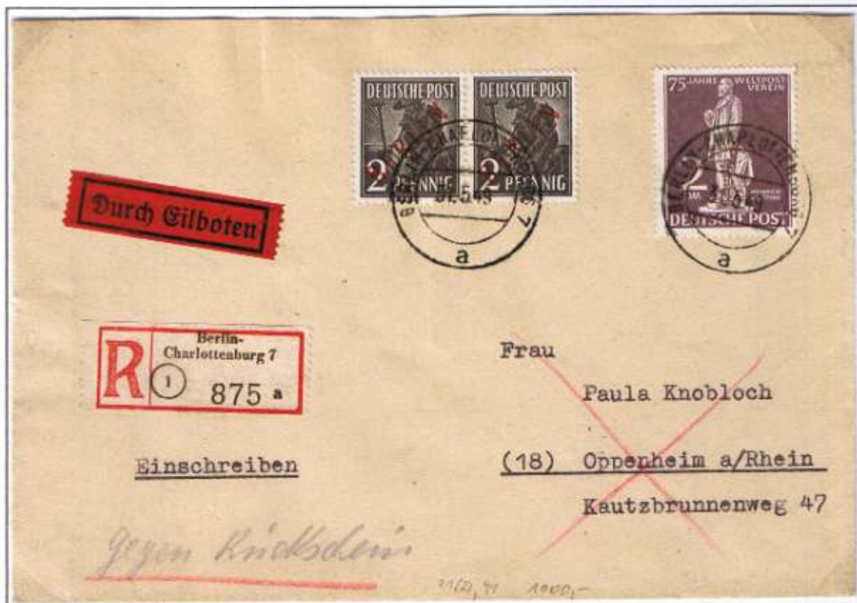
31.05.49: Letzttag des 1. Inland-Tarifes. Berlin-Charlottenburg 7, 31.05.49. Brief bis 20 g: 24 Pf, Einschreiben (ab 11.03.49): 40 Pf, Rückschein: 60 Pf und Eilboten: 80 Pf. Während des Eisenbahnerstreiks über die Luftbrücke abgeleitet. Rückseite: Ankunft (Sonderstempel) Oppenheim, 02.06.49.