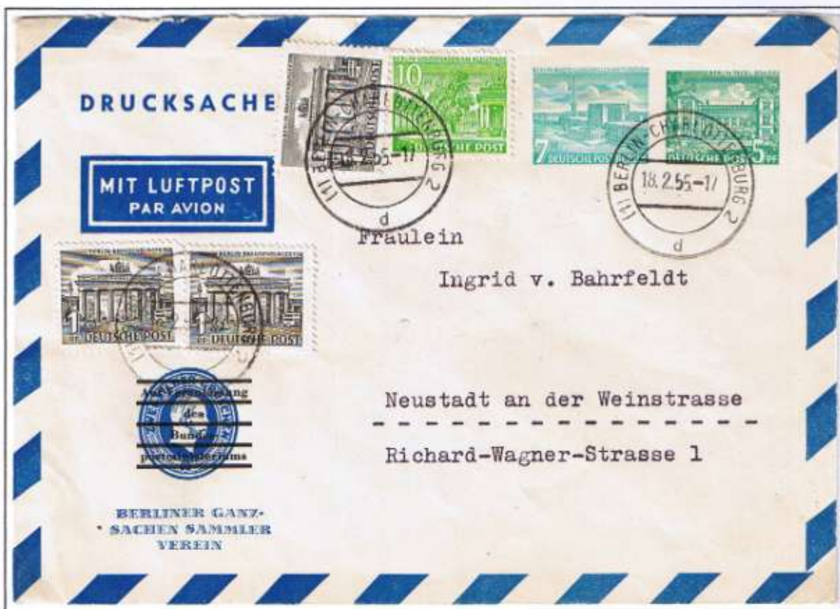
Privat-Ganzsachen-Umschlag mit zwei Werteindrucken (Dauerserien). Berlin-Charlottenburg 2, 18.02.55. Ex-Drucksache als Fernbrief bis 20 g: 20 Pf und Luftpostzuschlag: 5 Pf.