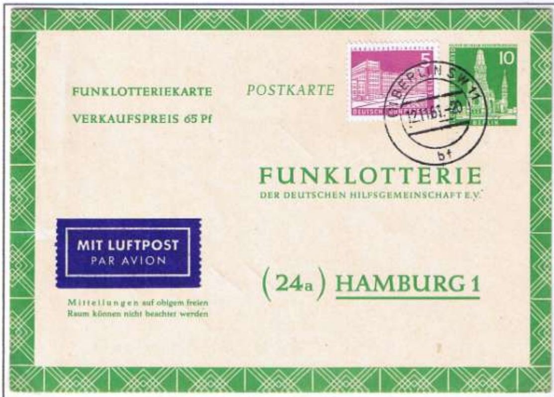
Berlin SW 11, 12.11.61, FP 5. Werteindruck : 10 Pf Gedächtniskirche, Dauerserie „Berliner Bauten II“. Gültig von 1957 bis 31.12.64. Nur mit Luftpostzuschlag 5 Pf bis 28.02.63. Rückseitig mit roter Los-Nummer 050344.