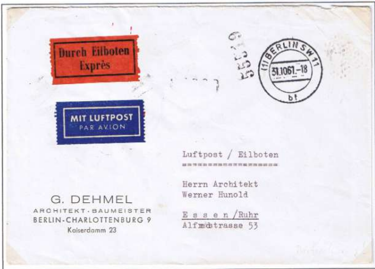
Barfrankierung oder Durchrutscher? Berlin SW 11, 31.10.61. Brief bis 20 g: 20 Pf, Luftpost: 5 Pf und Eilboten: 60 Pf. Rückseite: Ankunft Essen, 01.11.61 -5 Uhr und Essen-Eilbriefstelle, 01.11.61 -8 Uhr.