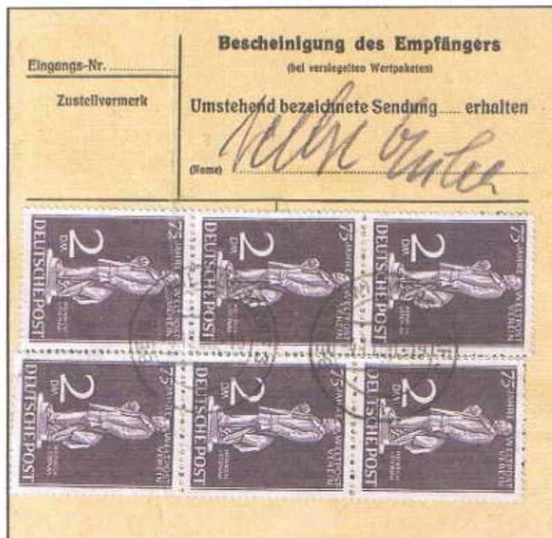
Rückseite mit zwei senkrechten Dreierstreifen.

Berlin-Wilmersdorf 3, 04.11.50 (Zweig-Postamt). 19. Gewichtsstufe, 10 kg in die 4. Zone über 375 - 750 km: 2,90 DM und Luftpostzuschlag: 10 DM. Tarif: 19.06.49 - 31.10.51, jedoch erst ab 01.08.49 waren Gewichte über 7 kg zulässig in fünf Entfernungszonen.