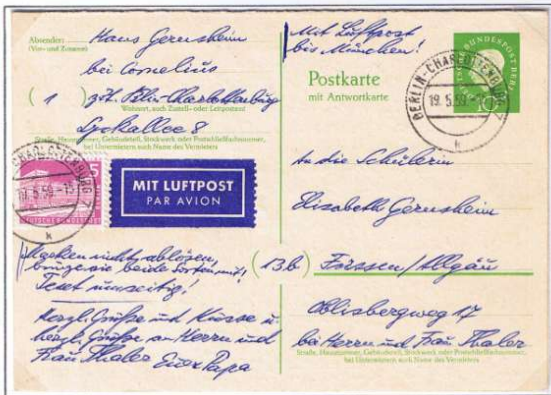
Unzertrennte Inlandspostkarte (F-Teil) mit anhängender Antwortkarte. Erstausgabe: 1959. Berlin-Charlottenburg 7 (ZwgPA, Bahnhof Zoologischer Garten), 19.05.59. Fernpostkarte: 10 Pf und Luftpostzuschlag: 5 Pf. Leitvermerk: Luftpost bis München. Inlands-Luftpost-Tarif: 19.06.49 - 28.02.63.