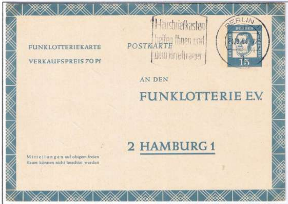
Berlin 11, 24.09.66. Anlässlich der Portoerhöhung für Postkarten auf 15 Pf zum 01.03.63, erschien Berlin 7 mit Werteindruck „M. Luther“, die ohne Zusatzfrankatur bis 31.03.66 verwendet werden konnte.