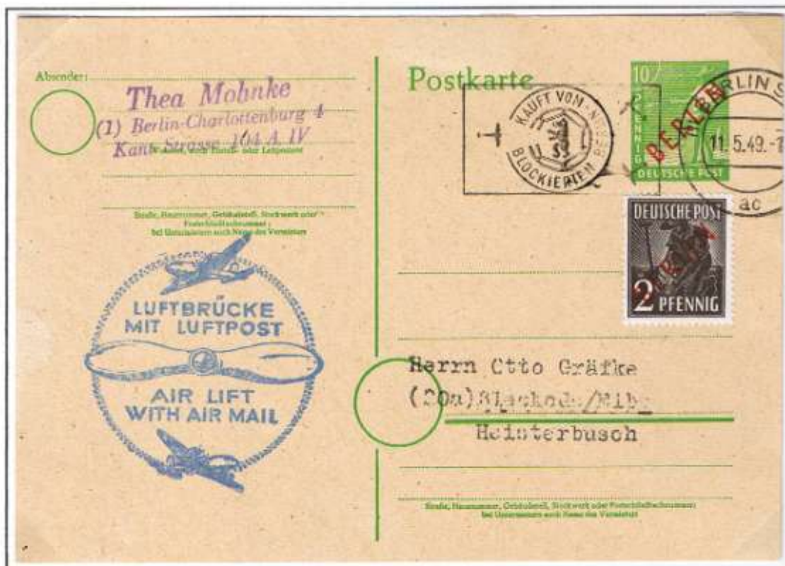
Letzttag Berlin-Blockade und Letzttag Werbefeldeinsatz „Kauf vom blockierten Berlin“. Berlin SW 11 ac, 11.05.49. Blauer Flugleitstempel der Firma T. Mohnke, Berlin, aptiert aus Leitstempel mit „100 Tage“ (siehe oben), auf erster, auf frankierter Westmark-Ortspostkarten-Ganzsache.