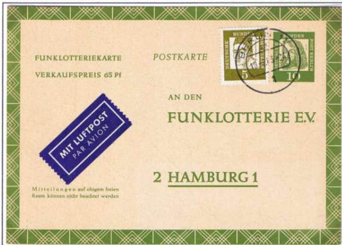
Berlin 11, 18.02.63. FP 6. Auflieferung um 24 Uhr, im Tag und Nacht geöffneten Bahnhofspostamt. Werteindruck: 10 Pf Albrecht Dürer, Dauerserie „Berühmte Deutsche“. Gültig von 1962 bis April 1969. Da am 01.03.63 eine Postkartenerhöhung auf 15 Pf erfolgte, waren reine Luftpostzusätze mit 5 Pf, hier 11 Tage vor der Gebührenerhöhung, nur von 1962 bis zum 28.02.63 möglich. Rückseitig mit großer schwarzer Los-Nummer 52113.