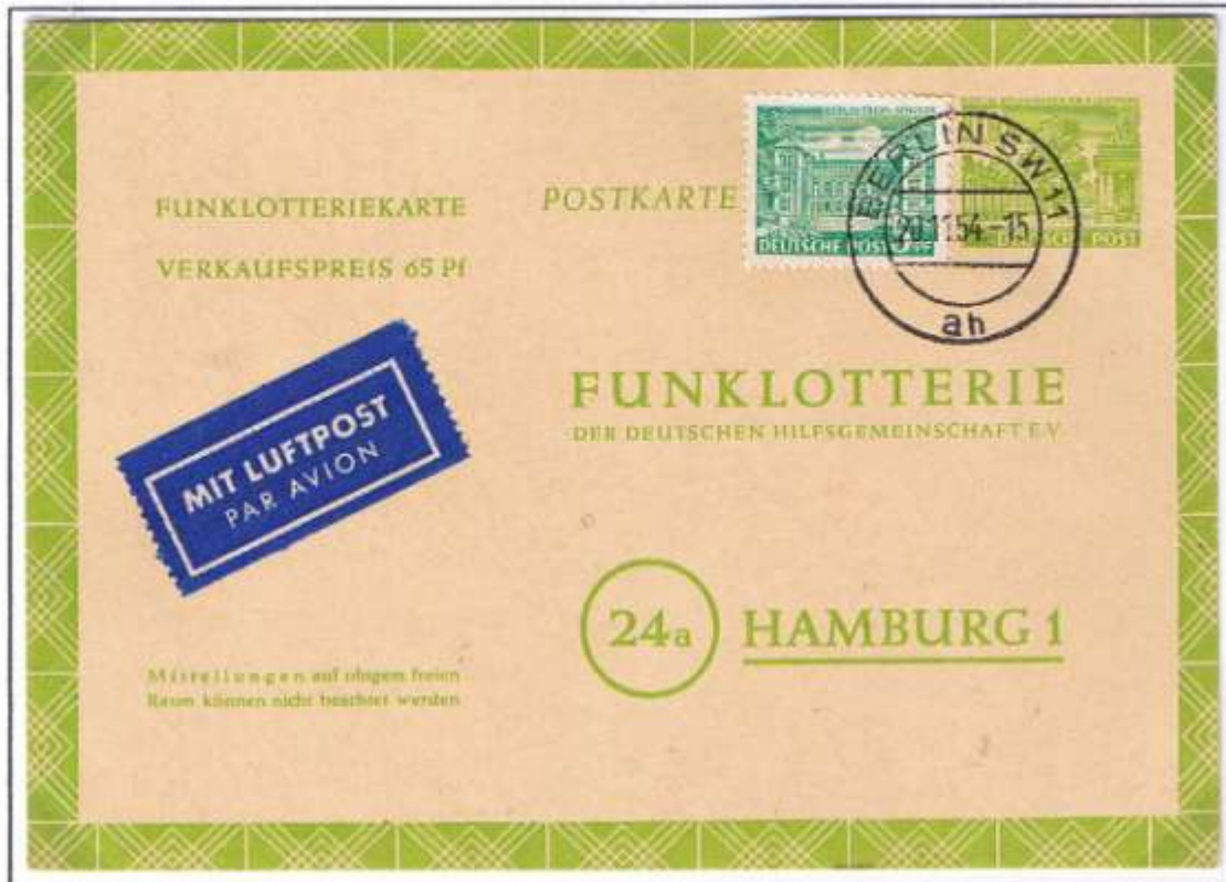
Neue Funklotterie-Postkarte (FP 4 vom 12.10.53 nach dem Betrugsskandal). Alter Wertstempel 10 Pf „Kolonnaden am Kleistpark“ mit neu gestaltetem Erscheinungsbild: Umrandung jetzt aus 28 Einzelfeldern mit sich kreuzenden Dreiecken (sog. Dreiecke im Schottenmuster). Verkaufspreis: 65 Pf. Postleitzahl in größerem Ring. Satt-grüner Farbton auf sämisch farbigem Karton. Berlin SW 11, 20.11.54.