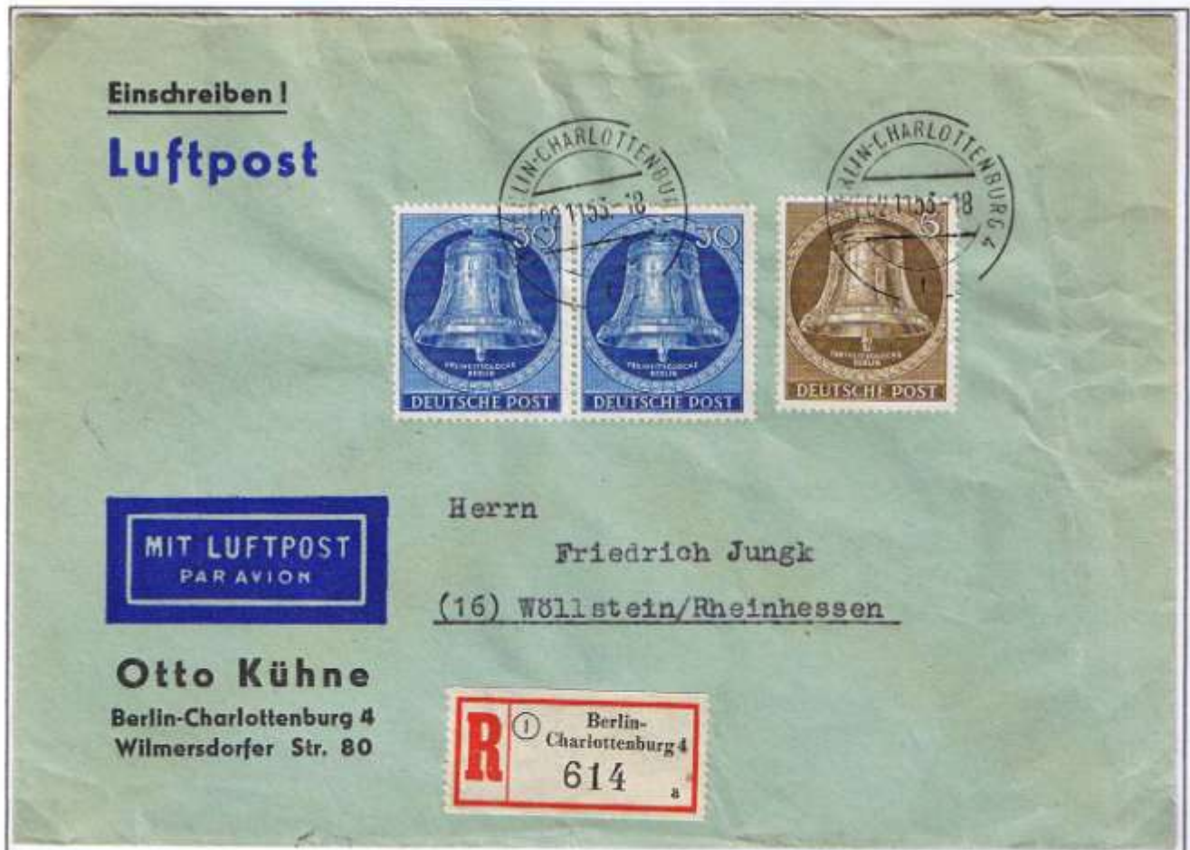
Berlin-Charlottenburg 4 (Postamt), 02.11.53. Fernbrief bis 20 g: 20 Pf, Luftpostzuschlag: 5 Pf und Einschreiben: 40 Pf. Ankunft: Wöllstein, 03.11.53.